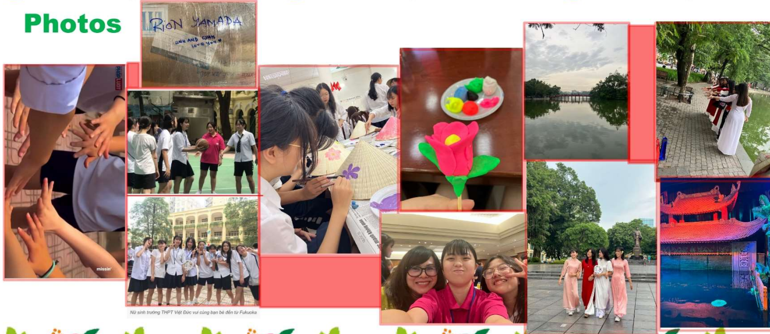
Nữ sinh trường THPT Việt Đức với cùng bạn bè đến từ Fukuoka