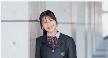
福岡大学 経済学部 産業経済学科 合格