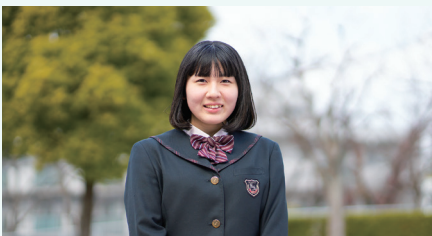
九州産業大学 地域共創学部 地域づくり学科 合格

3年間を通して、目標に向け努力を重ねることの重要性を実感しました。部活動では、全国大会優勝を果たし、仲間と共に夢を叶えた喜びは一生の宝物です。学業においても、計画的に取り組むことで将来に向けて自信をつけることができました。大学では新たな学びのなかで自分を成長させ、次のステップへと進んでいきたいです。