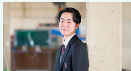
トヨタ自動車株式会社 内定

この九州産業高校で3年間を過ごし、同じ目標を持つ仲間と切磋琢磨できる環境や、放課後も遅くまで熱心に指導してくださる先生方の支えが大きくなり、志望校に合格することができました。将来は地域活性化に貢献できる人材を目指し、大学では勉学はもちろん、様々なことに挑戦し自分の可能性を広げていきたいです。